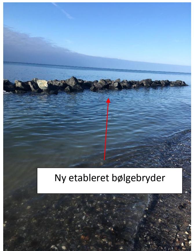
Ny etableret bølgebryder