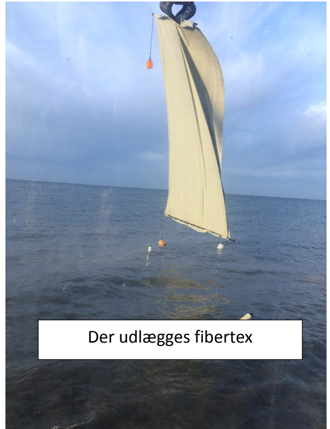
Der udlægges fibertex

Med stor maskinpark. Professionelt mandskab med mere end 30 års erfaring.